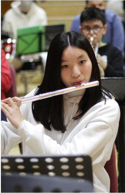
Imagen de un ensayo de orquesta de Orquesta Escuela como parte de la Red Música Social.