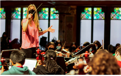
Imagen de un concierto de Orquesta Escuela como parte de la Red Música Social.