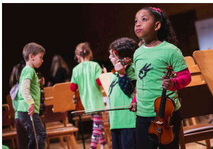
Imagen de una actuación de la Asociación Orquesta Escuela Zaragoza en el Auditorio.