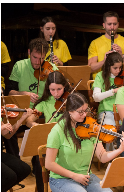
Imagen de una actuación de la Asociación Orquesta Escuela Zaragoza en el Auditorio.

Nuestra propuesta se fundamenta en la agenda 21 de la cultura, ofreciendo una experiencia artística innovadora, que favorece el intercambio de experiencias, dando visibilidad a los procesos. Nuestro objetivo es hacer realidad un modelo de desarrollo sostenible anclado fuertemente en la cultura, construyendo a través de la música una ciudadanía empoderada que pueda consumir, producir y validar su propia cultura.