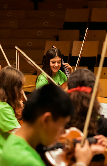
Imagen de una de las actuaciones de la Asociación Orquesta Escuela Zaragoza en el Auditorio de Zaragoza.