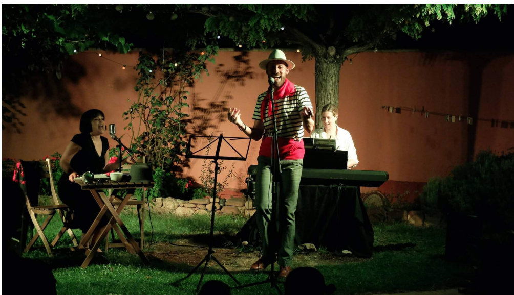
Fotografía de una de las actuaciones de Recuerdos en Canciones.

Aproximadamente unos 420 asistentes entre las 11 localizaciones.