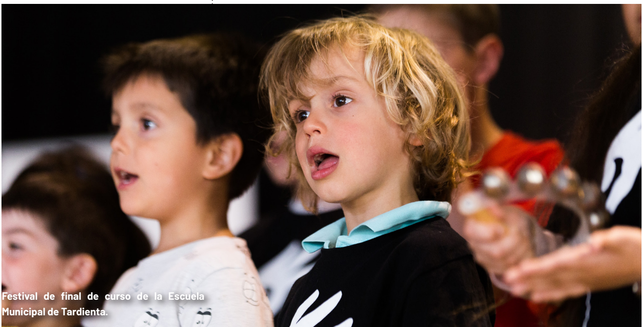
Festival de final de curso de la Escuela Municipal de Tardienta.

– Festival de navidad realizado el 18 de diciembre en el Centro Cívico de Tardienta.