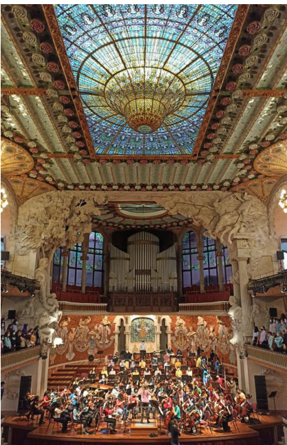
Imagen de un concierto de Orquesta Escuela como parte de la Red Música Social.

La Asociación Orquesta Escuela ha demostrado a lo largo de sus años de trayectoria que la calidad musical no es incompatible con el interés social y comunitario de los proyectos artísticos. La búsqueda de la inclusión social, más allá de la excelencia artística, no es incompatible con la búsqueda de la calidad de sonido.