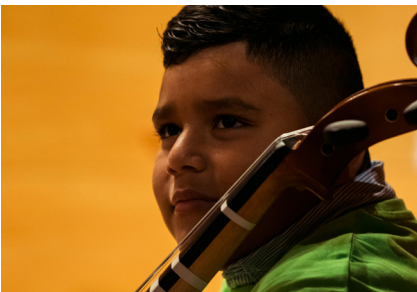
Imagen de una de las actuaciones de la Asociación Orquesta Escuela Zaragoza en el Auditorio de Zaragoza.

Uno de los principales objetivos de nuestra asociación, como así lo recogen los estatutos, es la creación de redes de cooperación entre agentes públicos y privados para la consecución de unos logros que suponen un bien común para toda la ciudadanía: el fomento y difusión de la cultura de la música clásica en nuestras comunidades.