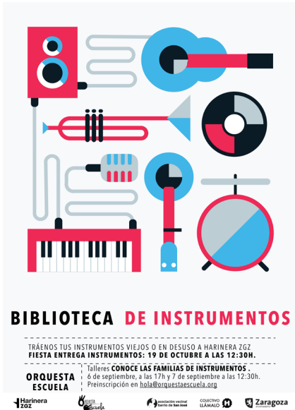
Cartel de una de las actividades de la "Biblioteca de Instrumentos musicales".