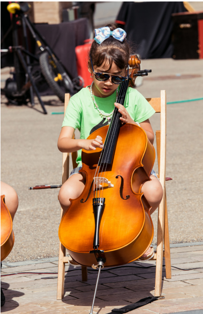
Imagen de un concierto de la Asociación Orquesta Escuela Zaragoza en el Edificio Pignatelli.