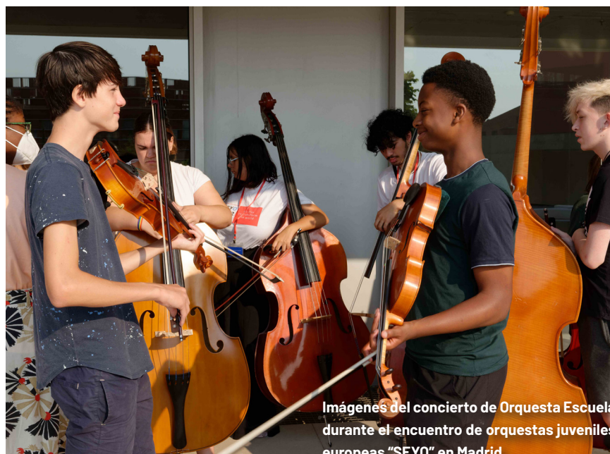
Imágenes del concierto de Orquesta Escuela durante el encuentro de orquestas juveniles europeas "SEYO" en Madrid.