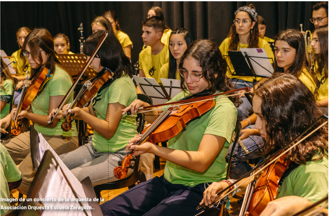
Imagen de un concierto de la orquesta de la Asociación Orquesta Escuela Zaragoza..