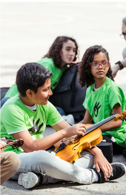
Imagen de una de las actuaciones de la Asociación Orquesta Escuela Zaragoza durante la muestra de actividades "San José en Movimiento".

De los múltiples datos y estadísticas que se realizaron, cabe destacar la encuesta realizada a los menores de edad que habían "repetido curso" y pertenecían a la orquesta solidaria frente a los que no. Mientras que los menores beneficiarios del proyecto señalaban como principales causas de la pérdida del año escolar "No entender lo que me enseñaban", "Estar vago" o "Faltar mucho a clase", los no beneficiarios señalaban razones como "Cambio de domicilio", "Problemas económicos en casa" (no poder pagar un profesor de refuerzo, tener que ayudar en casa...) y otras razones fundamentalmente externas a su propia capacidad o responsabilidad propia. Con esta estadística se demuestra claramente que el aprendizaje colaborativo de la música enseña a estos colectivos de menores con problemas de integración la importancia del esfuerzo personal e individual para la consecución de logros. Concretamente, tras el paso de 3 anualidades en la formación, se ha medido un incremento del 7% en valores como la perseverancia y la disciplina.