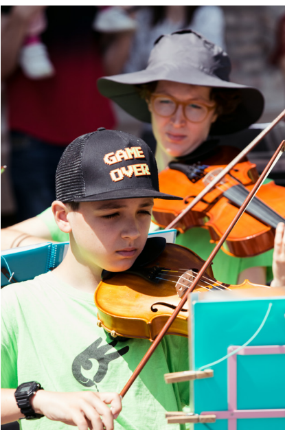
Imagen de un concierto de la Asociación Orquesta Escuela Zaragoza en el Edificio Pignatelli.