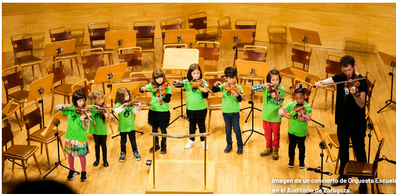
Imagen de un concierto de Orquesta Escuela en el Auditorio de Zaragoza.