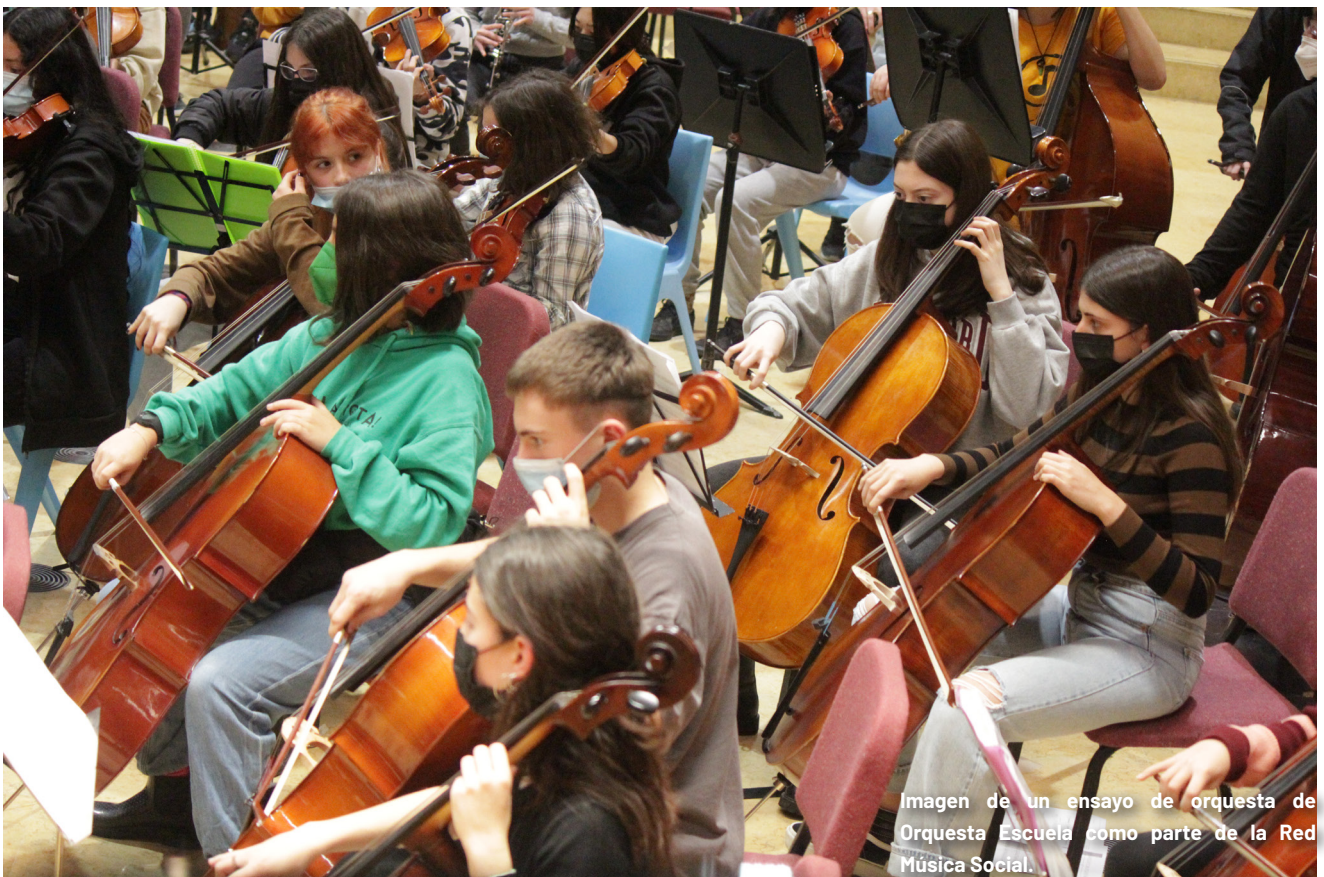
Imagen de un ensayo de orquesta de Orquesta Escuela como parte de la Red Música Social.

El curso ha concluido con 123 estudiantes en las actividades extraescolares que impartimos en un total de 4 centros educativos y 1 espacio cultural.