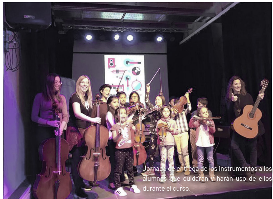
Jornada de entrega de los instrumentos a los alumnos que cuidarán y harán uso de ellos durante el curso.