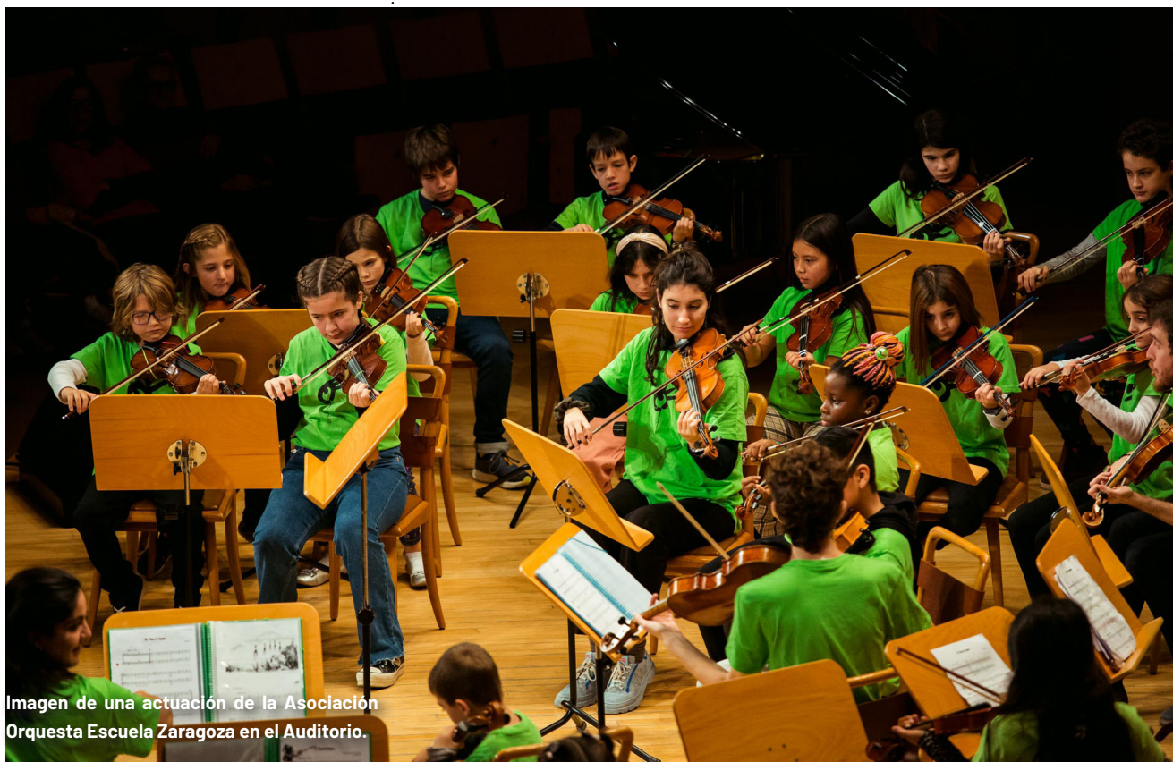
Imagen de una actuación de la Asociación Orquesta Escuela Zaragoza en el Auditorio.

Por lo tanto, cumplimos con una función de gran importancia social en cuanto a la creación de nuevos públicos para el género de la música clásica y especialmente la Sinfónica y Orquestal, acercando este repertorio a niños en riesgo de exclusión social e indirectamente, a sus familias. Como señaló Ara Malikian, premio global de la música aragonesa, hemos de abrir el círculo elitista que se ha creado en torno a la música clásica, pues cada vez hay menos público y menos joven. La pasión y afición por la música culta occidental y su enorme patrimonio y riqueza ha de crearse desde la infancia.