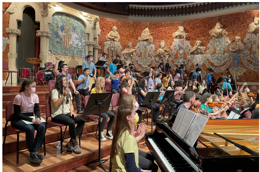
Imagen de un concierto de orquesta de Orquesta Escuela como parte de la Red Música Social.