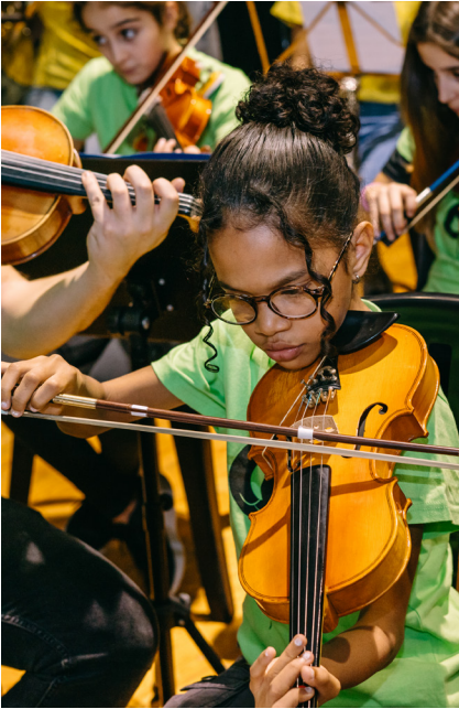
Imagen de un concierto de la orquesta de la Asociación Orquesta Escuela Zaragoza.