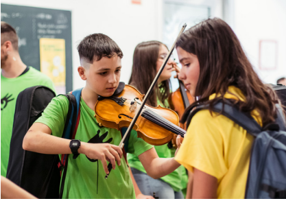
Imagen de una de las actuaciones de la Asociación Orquesta Escuela Zaragoza durante la muestra de actividades "San José en Movimiento".

— Casi la misma importancia tiene para el grupo de beneficiarios la alegría y ser alguien tranquilo (41% y 36% respectivamente). Para el grupo de no beneficiarios, el factor de ser alguien más tranquilo y pacífico tiene menos relevancia (29,3%)